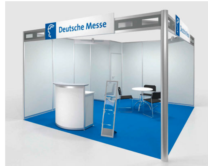
Systemstand Typ A plus erweiterte Möblierung