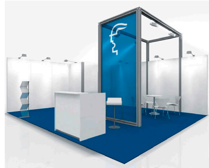
Systemstand Typ C plus erweiterte Möblierung