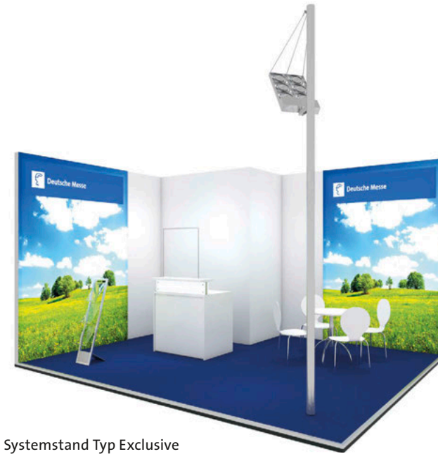
Systemstand Typ Exclusive

*** 20 m 2 Reihenstand mit Frühbucherpreis