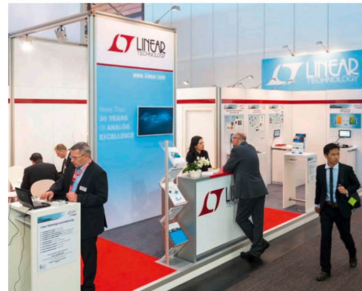
Gestaltungsbeispiel, enthält kostenpflichtige Zusatzausstattung