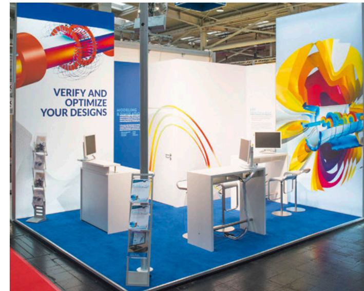
Gestaltungsbeispiel, enthält kostenpflichtige Zusatzausstattung